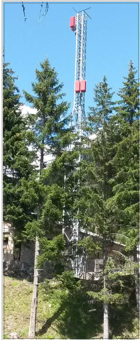
Esempio di postazione realizzata